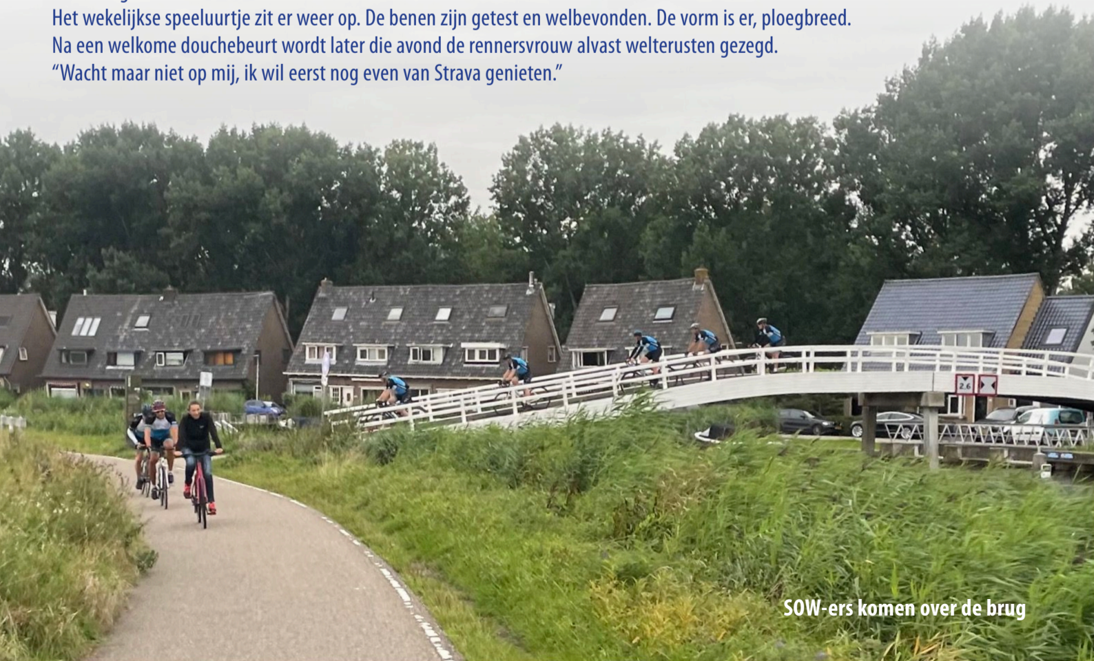
SOW-ers komen over de brug